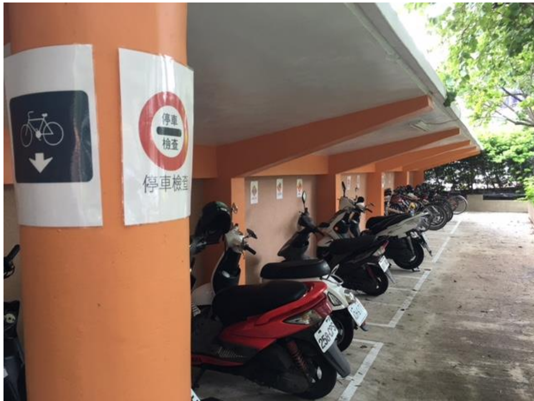
自行車停車檢查安全帽及車輛