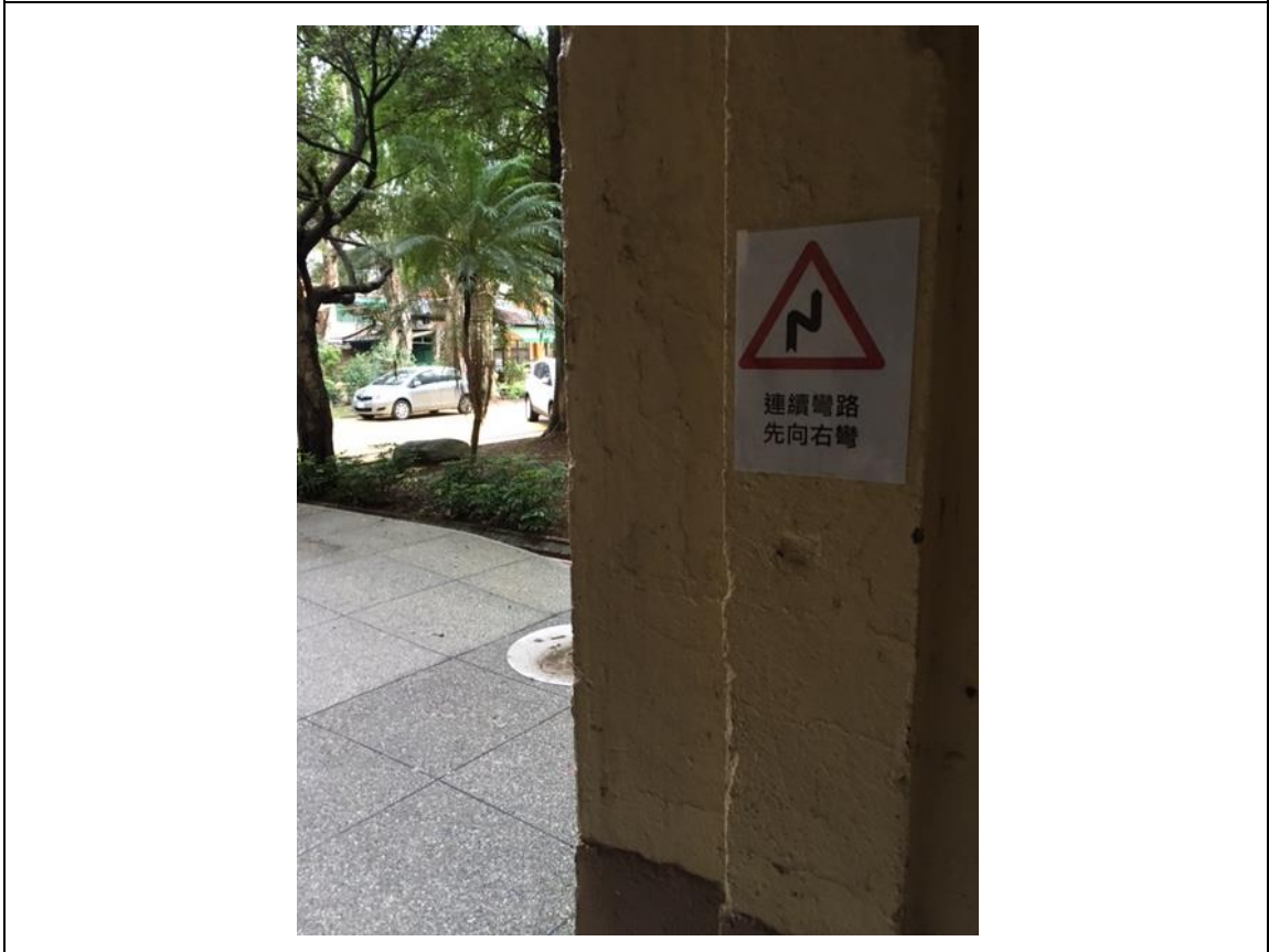
連續彎路先向右彎